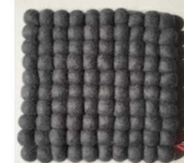
VV-16103 Trivet PLAIN GRAY