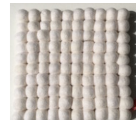
VV-16104 Trivet PLAIN WHT