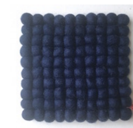
VV-16107 Trivet PLAIN NAVY