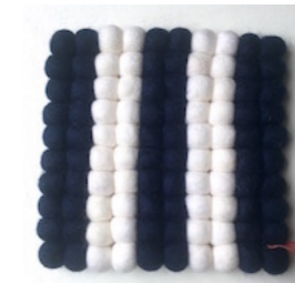
VV-16109 Trivet STRIPE NAVY x WHT

ブランド名の Vilt Van Ver (ヴィルト・ヴァン・ヴェール) とは、Felt From Far = 遙か遠くからやってきたフェルト、という意味。