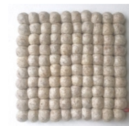
VV-16105 Trivet PLAIN ECRU