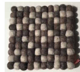
VV-16102 Trivet MIX EARTH

material: 100% wool | size: 約 20 x 20 x 2.5 cm | weight: 約 175g | retail price: 4,000 円